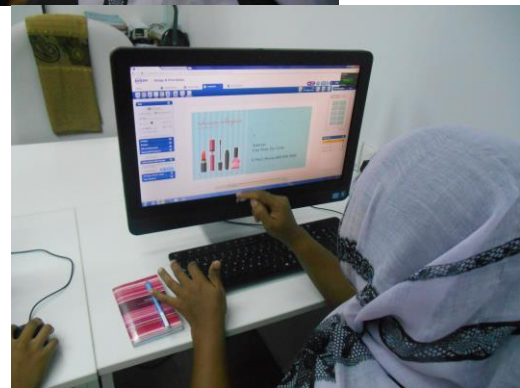
Pn. Raha menghasilkan kad perniagaan secara online