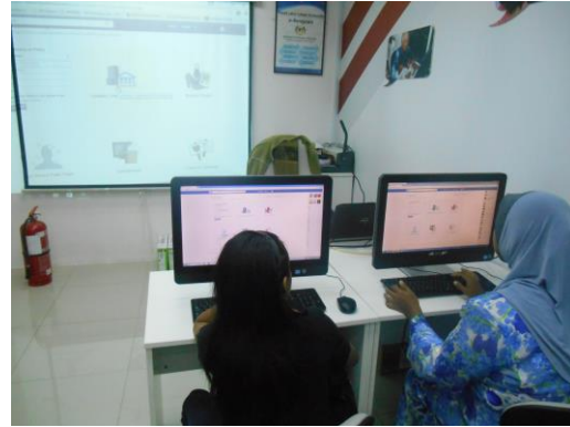
Pn. Raha membina Facebook Page perniagaan